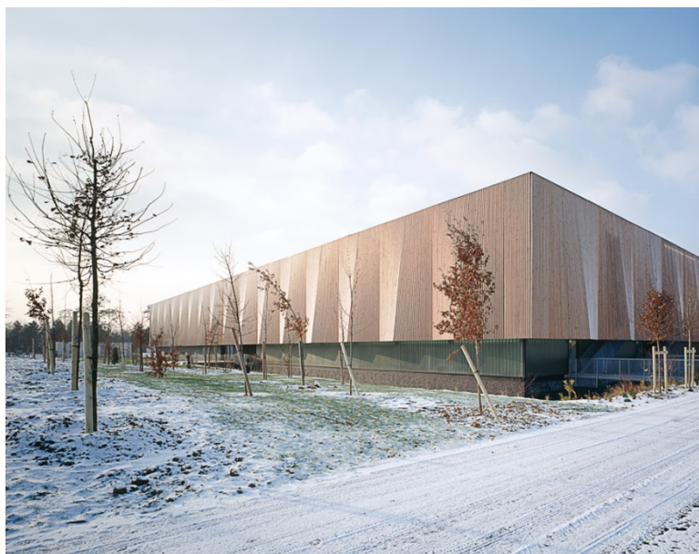
Pôle Sportif INSEP / PARIS

BVL architecture développe son activité principalement dans le cadre de la commande publique. Très tôt, confrontée au principe du concours, l'agence développe son savoir-faire par une participation régulière depuis plus de 10 ans sur ce type de procédure grâce à laquelle le parcours de l'agence s'est ponctué de réalisations clés et d'importance telles le Centre Aquatique de Saint Geours de Maremme et de Pôle Sportif de l'INSEP, qui ont permis son évolution qualitative et rigoureuse. L'agence s'ouvre les portes des équipements aquatiques et sportifs qui deviennent sa principale activité, tout en diversifiant son champ d'investigation vers d'autres approches programmatiques, notamment dans les secteurs de l'enseignement et des équipements médico-sociaux. L'agence forte de riches expériences, continue aujourd'hui son travail de recherche architecturale qualitative au service des utilisateurs.