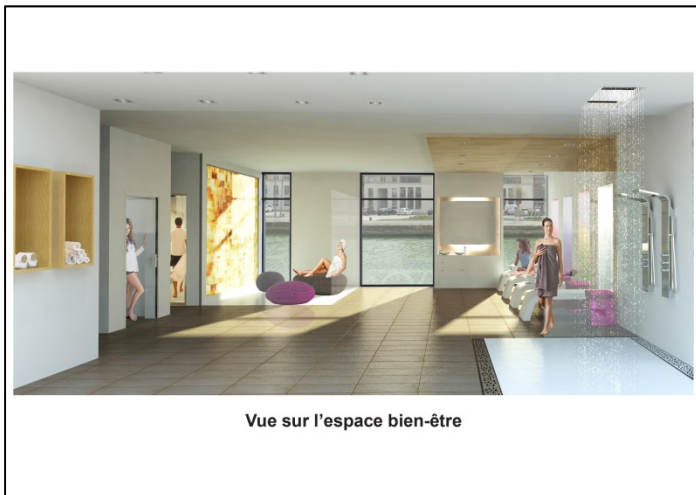
Vue sur l'espace bien-être