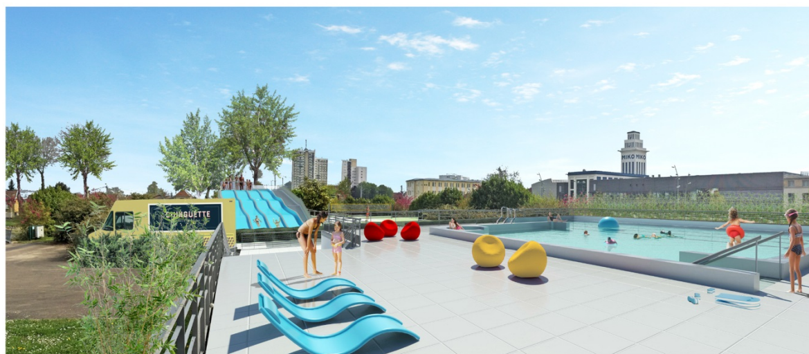
Vue vers solariums

« Dans ce projet, les espaces créés se perçoivent en fonction d'un plus large bâti. Nous ne sommes pas aspirés par eux, mais connectés à une multitude d'espaces mis en relation les uns les autres. 'Le site précède le programme'. Pour nous, la mémoire du lieu, la mise en réseau des différentes facettes du site, et la lecture en épaisseur d'un projet tel un processus et non un produit fini sont les véritables clés de lecture. C'est sur ce postulat que le projet s'est tissé, dans ses dimensions d'urbaniste, de paysage et d'architecture. Ainsi, la volumétrie et la matérialité des nouveaux espaces du centre nautique s'affichent dans un respect de la logique du bâti existant. L'implantation du bâtiment est largement dictée par la géométrie de la parcelle, ainsi que par une volonté d'insertion urbaine, paysagère et bioclimatique. Sur un axe Est-Ouest, la façade sud, apporte noblesse et consistance à l'équipement. Celle-ci se formalise en 'front bâti', et les espaces restructurés apparaissent sous l'utilisation rythmées de panneaux de façades en bois composite, ou sous la forme d'une extension vitrée. Dans le prolongement de cette façade Sud se développent les espaces extérieurs, en proue sur le canal. »