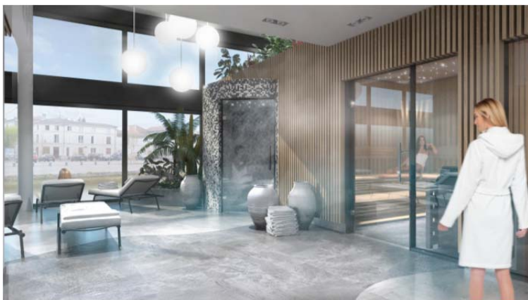
Vue sur hammam et sauna 2