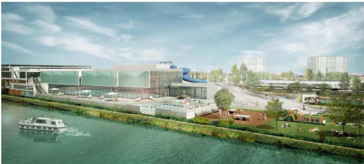
Vue depuis le canal