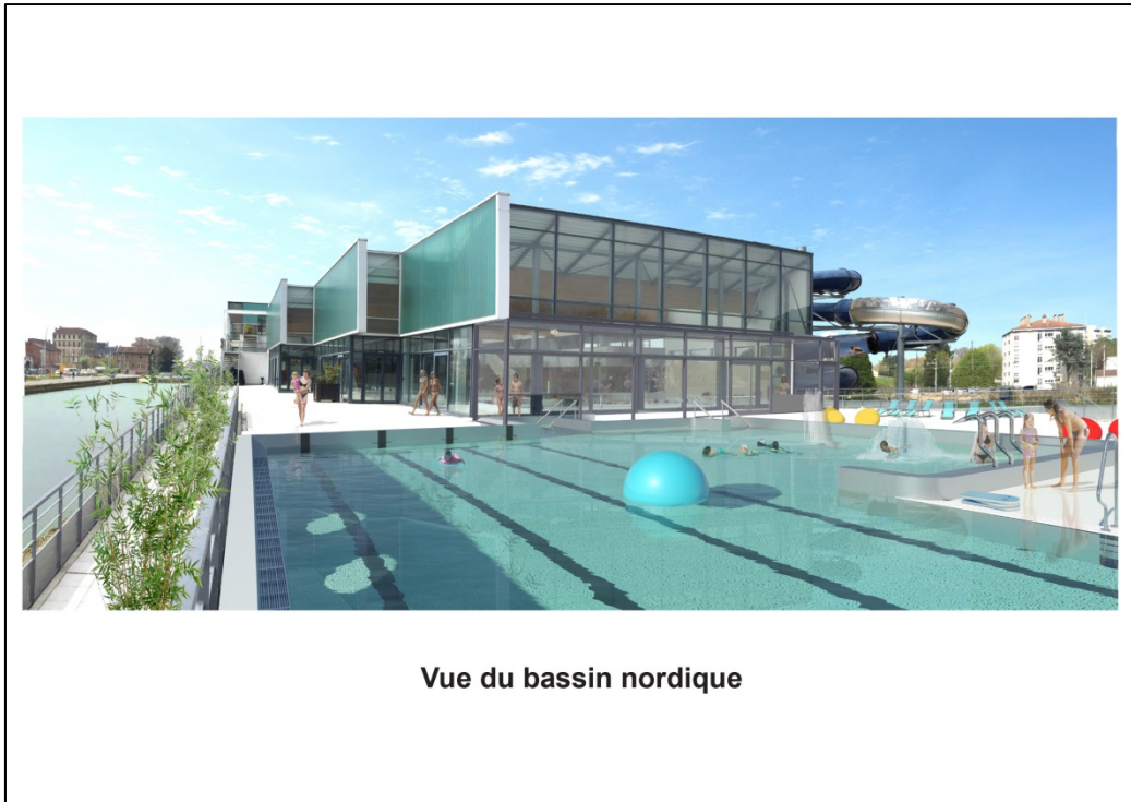
Vue du bassin nordique