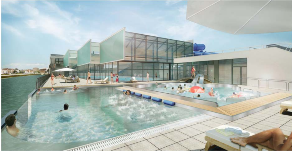
Vue sur le bassin nordique