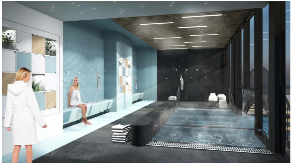
Vue sur mise à l'eau bassin nordique